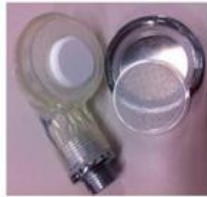
シャワーヘッド&タブレット シャワーヘッドに タブレットを入れるだけ

本商品「ワンちゃんネコちゃん炭酸シャワー」は、炭酸効果によって、ペットの皮膚環境や体調を整えていきます。ペットが健康キレイであれば、一緒に住む人間も健康でキレイな環境で生活することができます。