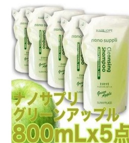
ナノサブリ グリーンアップル 800mLx5点