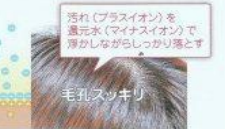
汚れ(プラスイオン)を還元水(マイナスイオン)で浮かせるがらさらさら落とす