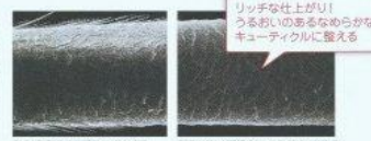
表面も細胞を修復するダメージ毛 毛根内部から汚染されたと修復後の健康毛