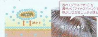
毛孔の狭小化と汚れの除去が頭皮のケア、フケ・カサにも効果的!

※香りシリーズ。に保護する葉草、18種類のアミノ酸、CMC、ペリセアで毛髪・頭皮を保護し強化します。皮膚の細胞を修復する働き、傷を治す治療作用、抗刺激作用があります。○アラントイン・植物性天然成分、保護・修復・治癒作用○分岐脂肪酸・毛髪細胞間脂質(CMC)○ペリセア…毛髪の保護、ダメージ補修○ゲンチアナ根エキス…抗酸化及び抗刺激作用、ダメージ防止○18種類のアミノ酸…ダメージ補修、ハリコシ・保湿力アップ、サラサラ・しっとり感向上