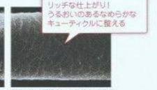
リッチな仕上がりがうるおいのあるゆめらかなキューティクルに整える