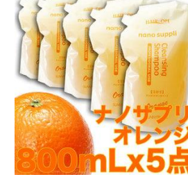
ナノサブリ オレンジ 800mLx5点