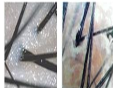
▲毛穴が詰まり、脂っぽくなった頭皮

シリコンには、ひどく傷んだダメージヘアのキューティクルをコーティングしてツヤと手触りをプラスしてくれる効果があります。しかしその反面、頭皮に蓄積し毛穴をつまらせて、クセや痛み、カラーリングの退色などさまざまなトラブルを引き起こしています!