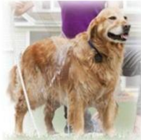
炭酸効果でワンちゃんネコちゃんも 炭酸シャワーが大好き!