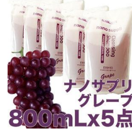
ナノサブリ グレープ 800mLx5点